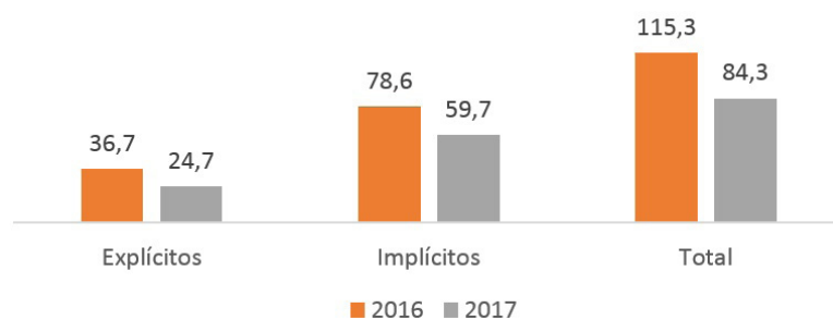
Gráfico III - Maiores Variações nos Benefícios em 2017 (bilhões R$)